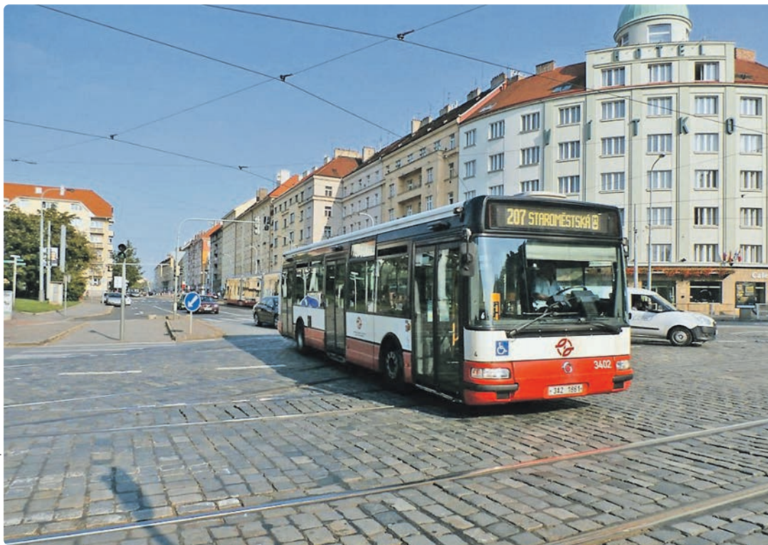
Ohrada je dopravně nejvytíženější křižovatka na Trojce.

K modernizaci místa se připojí i Dopravní podnik, který chce v parku vybudovat nabíjecí stanice pro elektromobily a v plánu je i rekonstrukce tramvajové za-