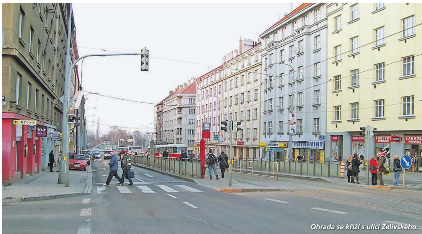
Ohrada se kříží s ulicí Želivského.

Parčík u Vinohradské nemocnice s nejsmutnějším hřištěm. To je název, který se hned tak nevidí. Spontánně ho takto překřtili lidé na facebooku, kteří o jeho současném nevhledném, a jistě tedy smutném stavu diskutovali. Nyní o jeho dalším osudu i podobě Ohrady rozhodnou obyvatelé Trojky spolu se studenty.