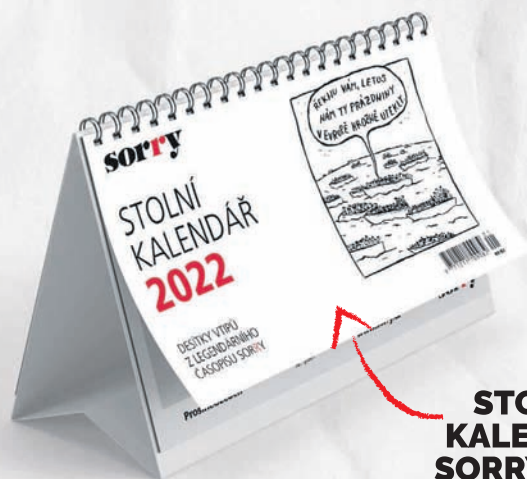
STOLNÍ KALENDÁŘ SORRY 2022