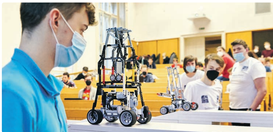
Team STV z Domu dětí a mládeže Prahy 2.

L etošní 13. ročník Robosoutěže Fakulty elektrotechnické Českého vysokého učení technického v Praze v prosinci vyvrcholil finálovým bojem. Cílem letošního ročníku bylo najít nejschopnějšího ROBO číšníka, respektive studentský tým, který jej dokáže postavit a naprogramovat. Robotické vozítko z lega muselo překonat dráhu s proměnným sklonem, aniž by mu z plošinky sjel vozíček. Napínavé finále klání středoškolských a univerzitních týmů vyhrál Team STV z Domu dětí a mládeže Prahy 2. Vítězem kategorie hodnotící design se potom stal tým Gymstr šestá Ó reprezentující gymnázium Strakonice.