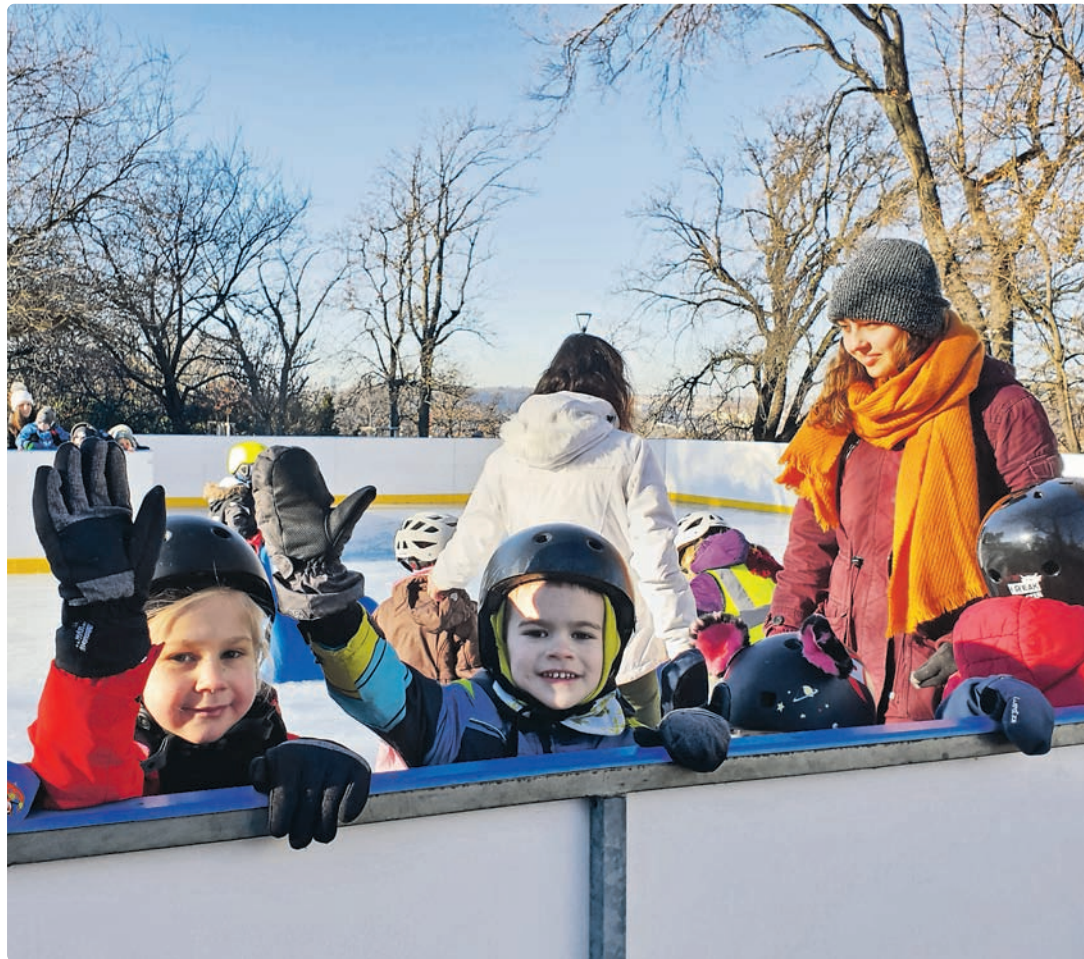
Od začátku prosince si mohou zájemci o bruslení užít tento sport v Grébovce a poprvé také v Riegrových sadech (na snímku).

Provozovatel garantuje dodržování aktuálních hygienických opatření v celém areálu včetně půjčovny bruslí. Pro mateřské i základní školy z Prahy 2 je vstupné zdarma, stejně tak i pro děti do 6 let. Celodenní vstupné je 50 korun. Pokud ne-