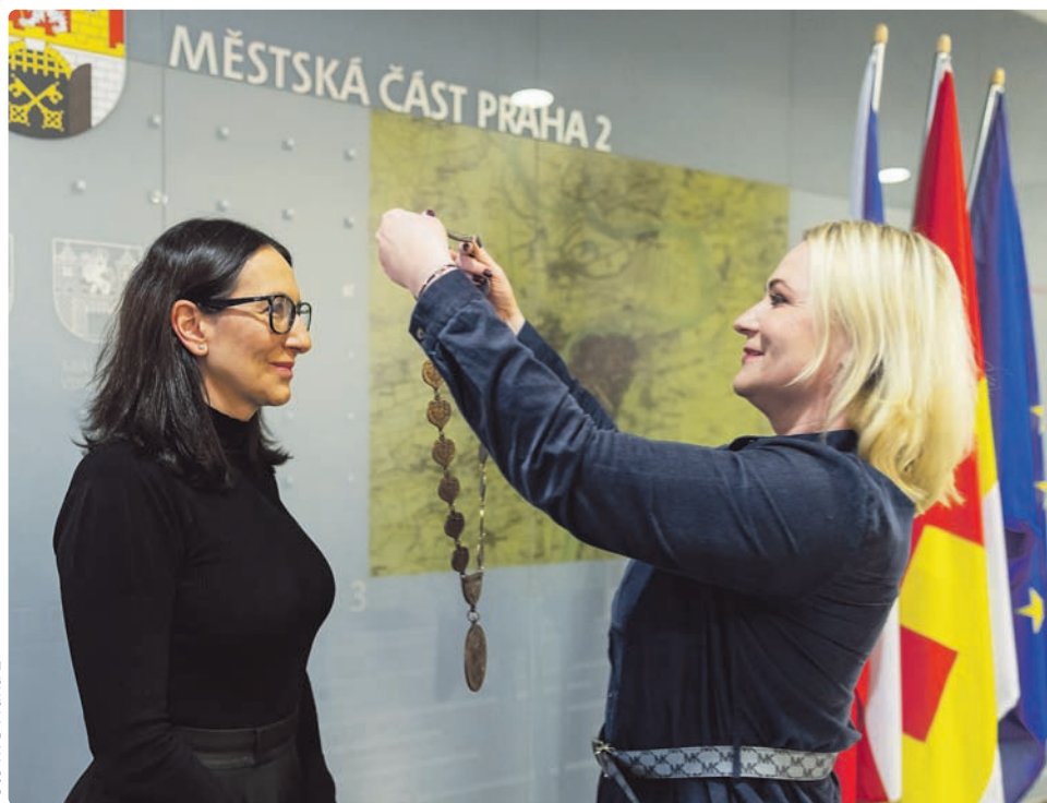
Novou starostkou Prahy 2 se stala dosavadní místostarostka Alexandra Udženija. Ta vystřídala dlouholetou starostku Janu Černochovou.

Nová starostka Alexandra Udženija chce na práci Jany Černochové navázat. „Budu k funkci starostky přistupovat odpovědně a ve vši vážnosti. Budu naslouchat vašim připomínkám, radám i kritice, moje dveře budou otevřeny pro vás všechny nejen z ko-