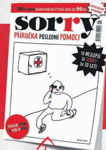
SORRY TO NEJLEPŠÍ ZA 30 LET