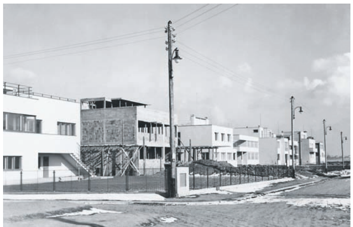
Magistrát zahájil zpracování územní studie na citlivou úpravu veřejných prostranství na Babě.