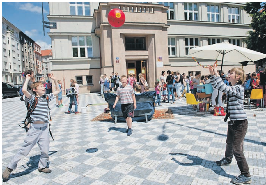
Zakončení projektu Bezpečně do školy, ZŠ nám. Svobody, Praha 6.

Naše průzkumy ukazují, že 44 % dětí považuje ranní provoz před školami za nepřijemný. Do některých škol je přitom autem dováženo až 40 % dětí. Kvůli narůstajícímu počtu aut jsou situace před školami stále nebezpečnější a chaotičtější a odrazují další rodiče od rozhodnutí pustit děti samotné pěšky. V rámci výzvy Pěšky do školy nabízíme rodičům a jejich dětem alternativu – jít alespoň