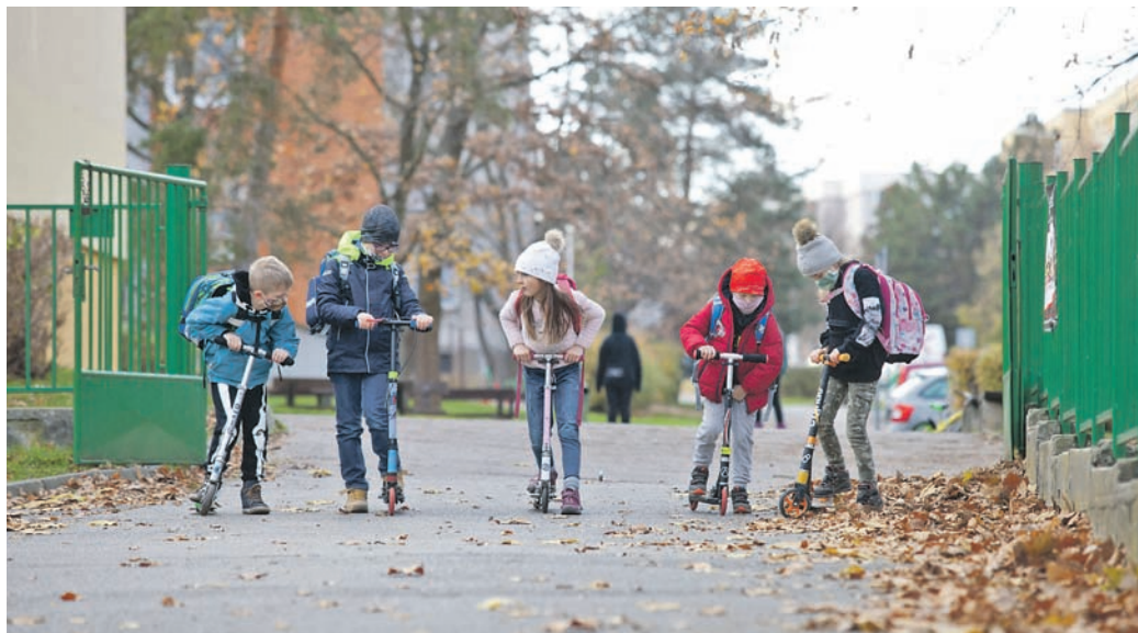
Pěšky do školy.

Objevují se tu úpravy, které lokálně zlepšují a usnadňují pěší pohyb (například rekonstrukce nároží u přečhodů, aby byly pro chodce bezpečnější). Důležité je zasazovat dílejší úpravy do širších celků v rámci koncepce rozvoje pěší dopravy, která stále chybí i na úrovni města. Neexistuje ani systémová podpora pro budování pěších propojení a liniových cest. Jednotlivé části Prahy 6 jsou odděleny kopci a nejrychlejší cesta, jak je překonat, je v některých případech stále ta autem. Zdravější alternativou pro lidi i pro čtvrt jsou právě zkratky a propojky, na které doporučuji obrátit pozornost a investovat do jejich úprav. Takovou ukázkovou cestou, která je zanedbaná, a přitom ji využívá řada lidí a zasloužila by obnovu, je zkratka lesem mezi