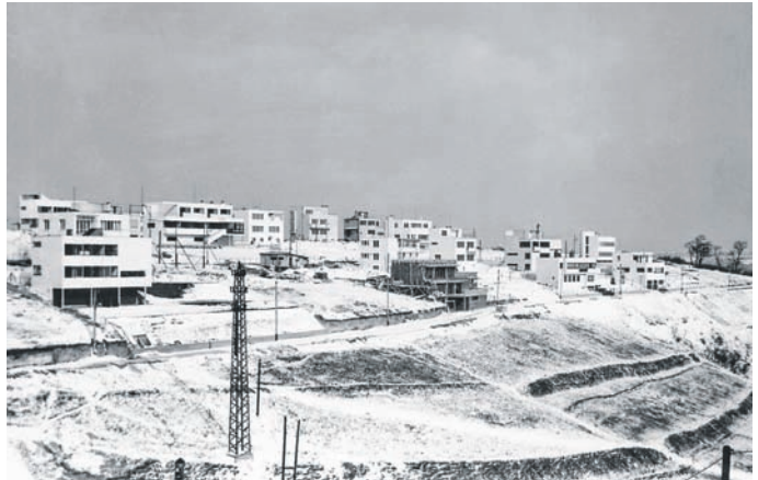
Kolonie Baba je soubor více než tři desítek ukázkových moderních vil postavených na přelomu dvacátých a třicátých let.

„Připravujeme revitalizaci tohoto veřejného prostranství s ohledem na původní vzhled v době výstavby obytného souboru Baba. Tehdy se jednalo o jedinečný a zároveň o jeden z posledních celoevropských urbanistických společných počínů výstavby na zelené louce. Cílem nové studie je podpora, zachování a rozvoj historické hodnoty na základě udržitelné památkové ochrany, zkvalitnění obytného prostředí pro místní obyvatele