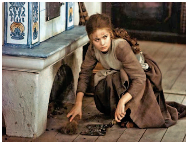
Na Popelku se rádi podíváme v televizi, neradi se v ní měníme.

A kdyby vám nezbyl čas vůbec na nic, aspoň umyjte a ozdobte vstupní dveře. Podle feng-šuej totiž znamenají bohatství a ozdobené přitahují do domu energii. Když za sebou při odchodu zavírate dveře s vánoční ozdobou, více si uvědomujete, že opouštíte domov, a ozdobené dveře vás do něj při příchodu zase vítají. A Vánoce, to přece je právě rodina a domov!