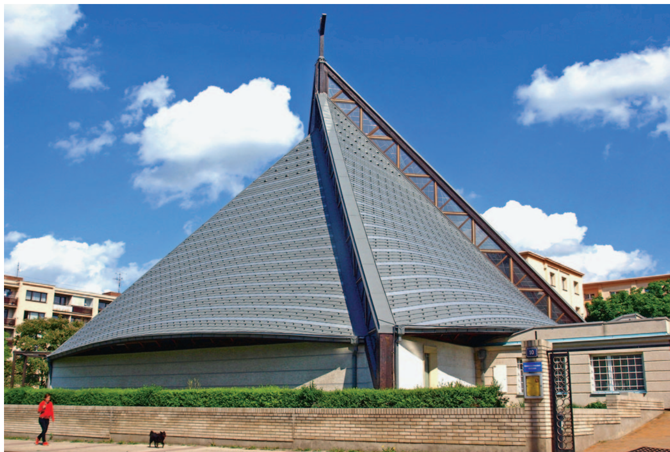
Budova kostela připomíná plášť Panny Marie

PŘIPRAVILA MARCELA NEJEDLÁ