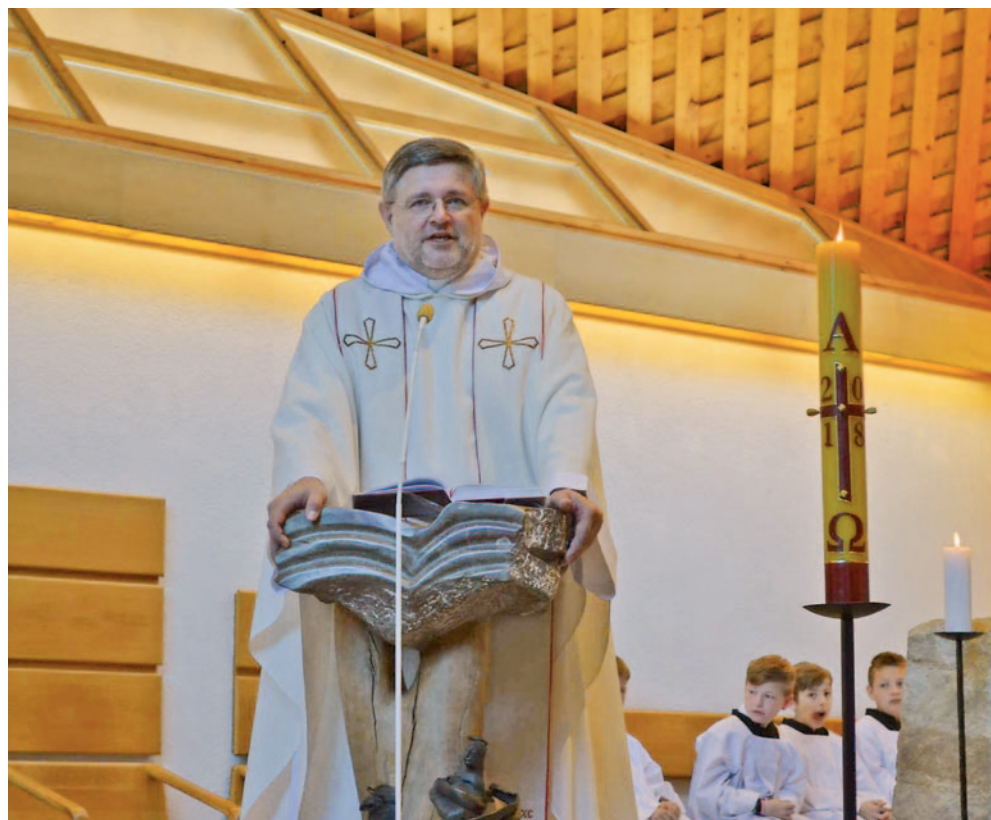
„Chci, aby moji svěřenci přemýšleli.“

u nás také vyučujeme náboženství, od malých dětí až po pubertáky. Ti tedy vyšli na mě.